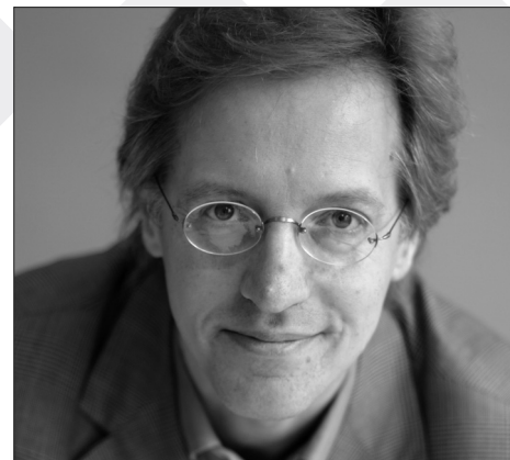
Prof. dr. Robbert Dijkgraaf Hoogleraar Mathematische fysica aan de UvA

Het wiskundig onderzoek aan de UvA vindt plaats binnen het Korteweg-de Vries Instituut voor wiskunde (KdVI). Het onderzoek strekt zich uit van zuivere wiskunde, inclusief logica, tot toegepaste wiskunde, statistiek en financiële wiskunde. Binnen het Instituut voor Bedrijfs- en Industriële Statistiek (IBIS) dat opereert binnen het bedrijfsleven, wordt onderzoek gedaan in de industriële statistiek. Tevens is de UvA de enige algemene universiteit in Nederland met een leerstoel Numerieke wiskunde.